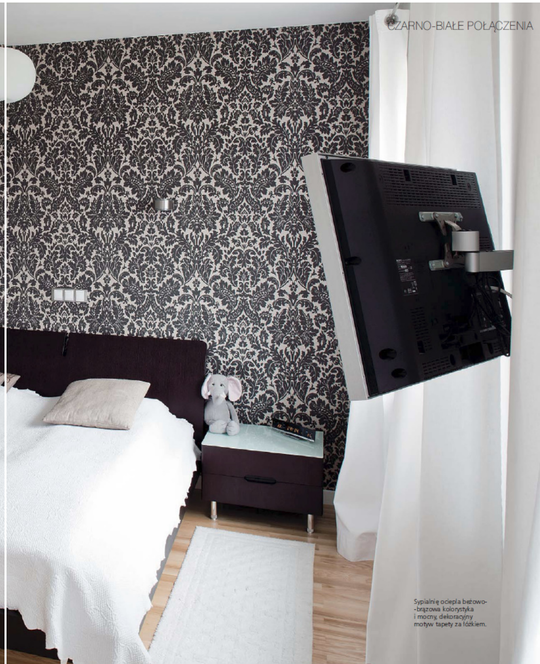
Sypialnię ociepla beżowo-brązowa kolorystyka i mocny, dekoracyjny motyw tapety za łóżkiem.